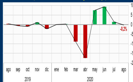
Gráfico 1: Alemania - Producción industrial (Variación mensual, en porcentaje)