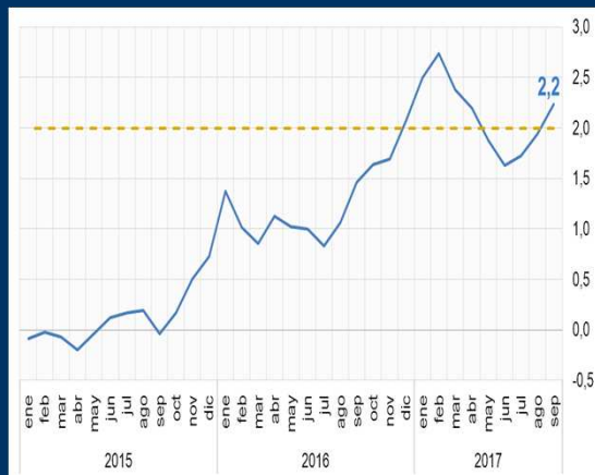
Gráfico 1: EE.UU. - Inflación interanual (En porcentaje)