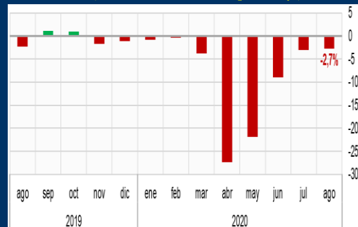
Gráfico 3: Brasil - Producción industrial (Variación interanual, en porcentaje)