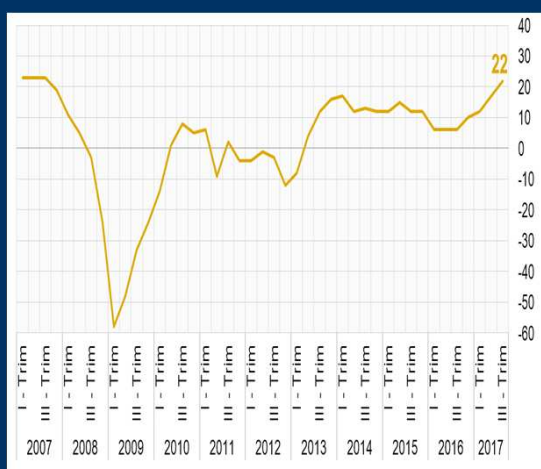
Gráfico 2: Japón - Índice de confianza empresarial (En puntos)