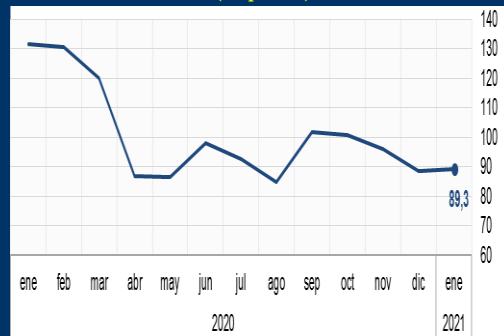
Gráfico 1: EE.UU. - Confiianza del Consumidor (En puntos)