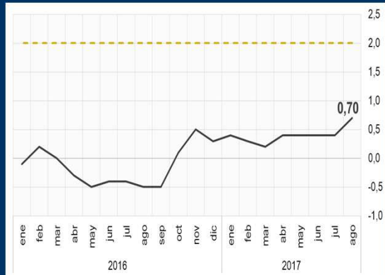
Gráfico 3: Japón - Inflación interanual (En porcentaje)