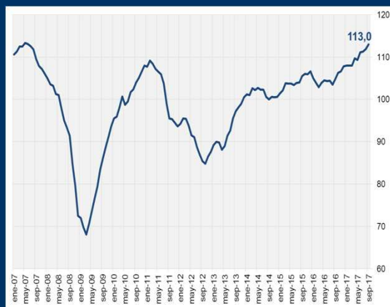
Gráfico 2: Zona Euro - Índice de sentimiento económico (En puntos)