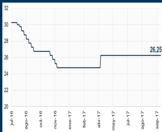
Gráfico 3: Argentina - Tasa de política monetaria (En porcentaje)