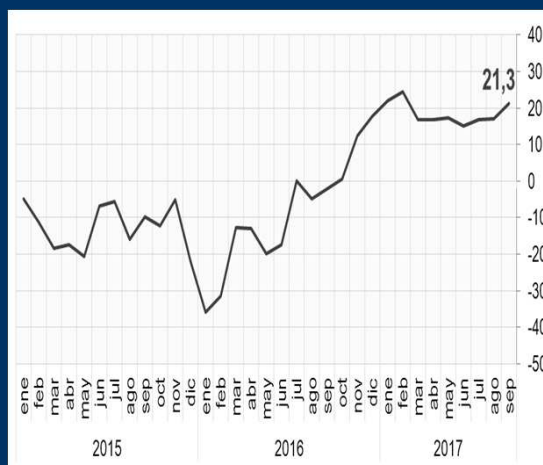
Gráfico 1: EE.UU. - Índice de la actividad manufacturera (En puntos)