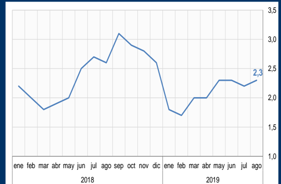
Gráfico 3: Chile - Inflación (Variación interanual; en porcentaje)