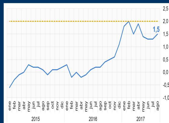
Gráfico 2: Zona Euro - Inflación (En porcentaje)