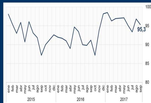
Gráfico 1: EE.UU. - Índice de sentimiento del consumidor (En puntos)