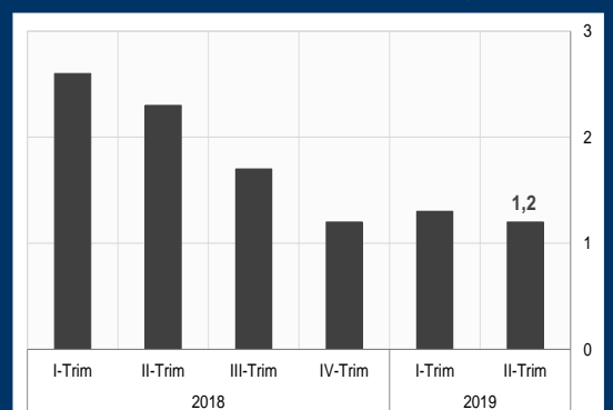
Gráfico 2: Zona Euro - Actividad económica (Variación interanual; en porcentaje)