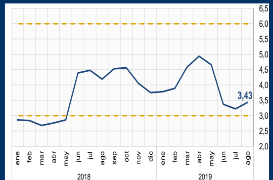
Gráfico 3: Brasil - Inflación (Variación interanual; en porcentaje)