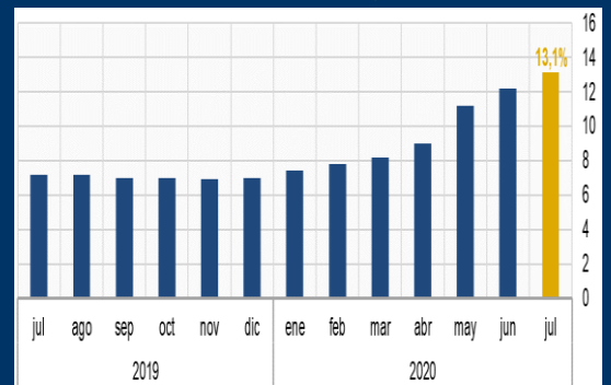
Gráfico 3: Chile - Tasa de desempleo (En porcentaje)