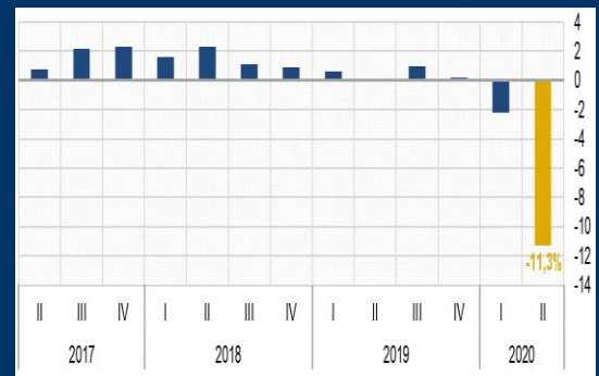
Gráfico 2: Alemania - Producto Interno Bruto (Variación interanual, en porcentaje)