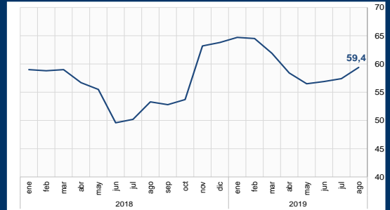
Gráfico 1: Brasil - Confianza industrial (En puntos)

Durante julio, la confianza del consumidor de Colombia se recuperó ligeramente aunque permanece en terreno negativo con el valor de -5,1. (Gráfico 3). La percepción sobre la situación actual mejoró moderadamente lo que permitió la recuperación en los niveles de compra de electrodomésticos y bienes inmuebles entre otros.