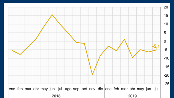
Gráfico 3: Colombia - Confianza del consumidor (En puntos)