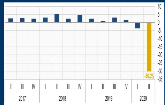
Gráfico 3: Perú - Producto Interno Bruto (Variación interanual, en porcentaje)