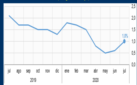
Gráfico 2: Reino Unido - Inflación interanual (En porcentaje)