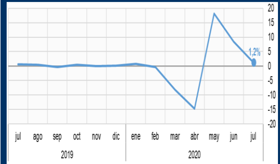
Gráfico 1: Estados Unidos - Ventas minoristas (Variación mensual, en porcentaje)