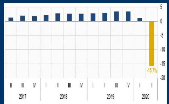
Gráfico 2: Colombia - Producto Interno Bruto (Variación interanual, en porcentaje)