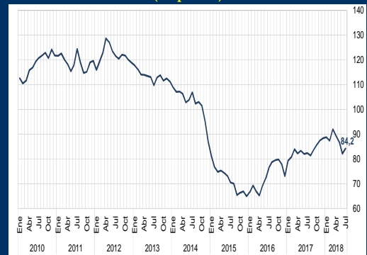
Gráfico 2: Brasil - Confianza del consumidor (En puntos)