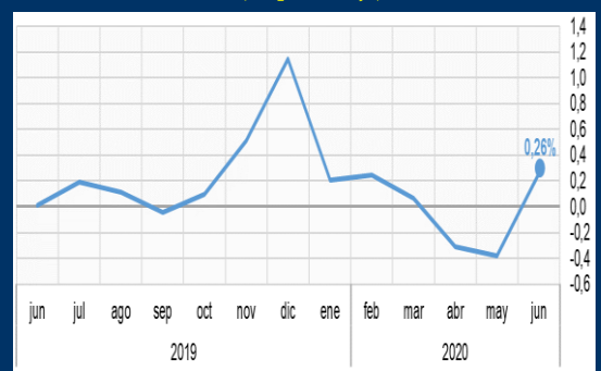
Gráfico 2: Brasil - Inflación mensual (En porcentaje)