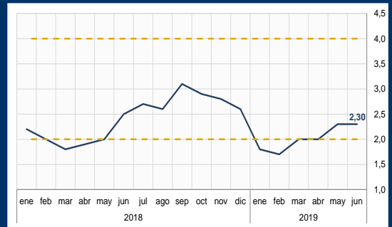
Gráfico 2: Chile - Inflación (Variación interanual; en porcentaje)