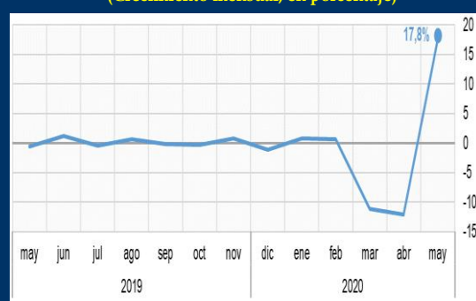
Gráfico 2: Zona Euro - Ventas minoristas (Crecimiento mensual, en porcentaje)