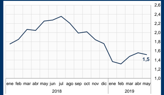
Gráfico 1: EE.UU. - Índice de precios de gasto del consumidor (En porcentaje)