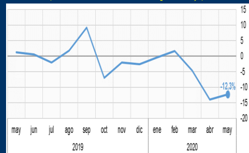
Gráfico 2: Japón - Comercio minorista (Crecimiento interanual, en porcentaje)