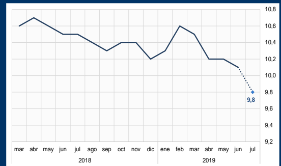
Gráfico 2: Alemania - Confianza del consumidor (En puntos)