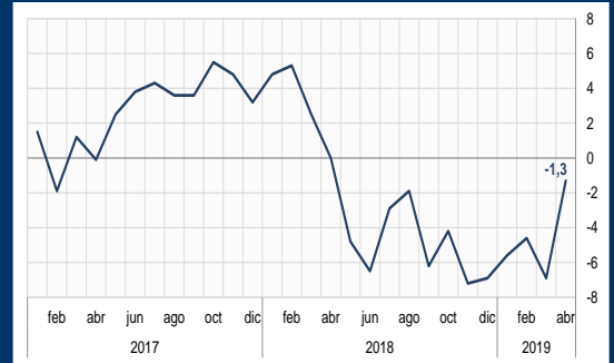
Gráfico 1: Argentina - Actividad económica mensual (En porcentaje)