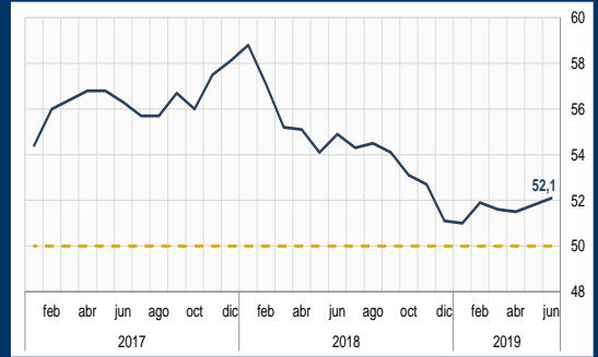
Gráfico 1: Zona Euro - PMI Compuesto (En puntos)