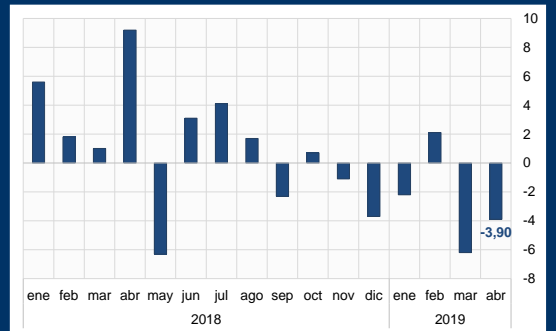
Gráfico 2: Brasil - Producción industrial (Variación interanual; en porcentaje)