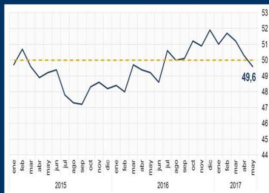
Gráfico 3: China - Índice Caixin PMI manufacturero (En puntos)