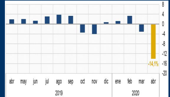
Gráfico 3: Chile - Actividad económica - IMACEC (Crecimiento interanual, en porcentaje)