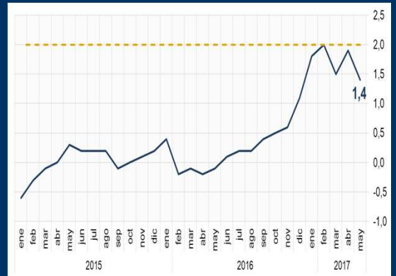
Gráfico 3: Zona Euro - Inflación (En porcentaje)