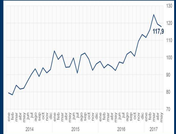
Gráfico 1: EE.UU. - Índice de confianza del consumidor (En puntos)