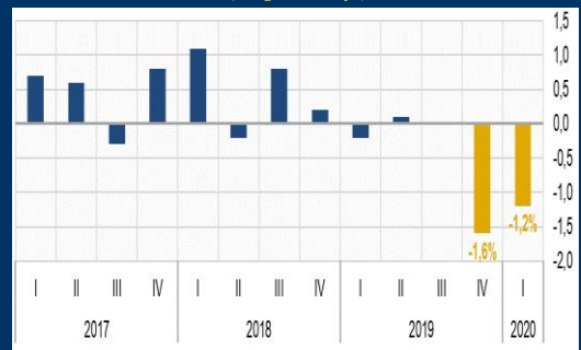
Gráfico 2: México - Crecimiento trimestral del PIB (En porcentaje)