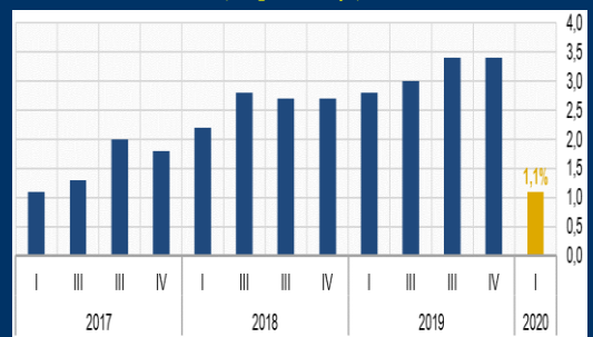
Gráfico 3: Colombia - Crecimiento interanual del PIB (En porcentaje)