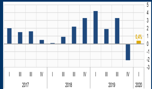
Gráfico 2: Chile - Crecimiento interanual del PIB (En porcentaje)