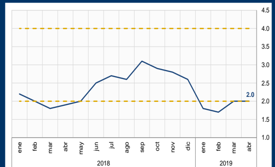
Gráfico 3: Chile - Inflación a 12 meses (En porcentaje)