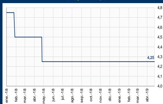
Gráfico 3: Colombia - Tasa de interés de política monetaria (En porcentaje)