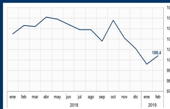
Gráfico 3: Japón - Índice coincidente (En puntos)