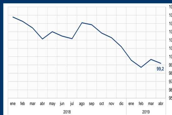
Gráfico 2: Alemania - Clima de negocio (En puntos)