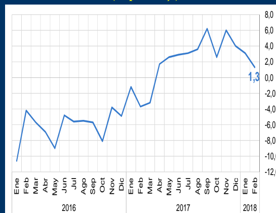
Gráfico 3: Brasil - Ventas minoristas (En porcentaje)