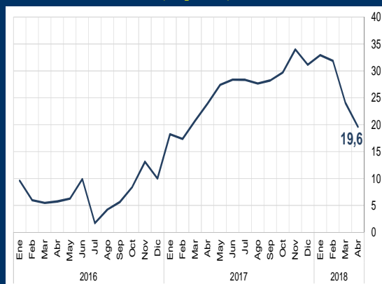
Gráfico 1: Zona Euro - Confianza del inversor (En puntos)

NOTA: 1 A partir del 15/11/2017, los activos del FPAH son invertidos de acuerdo a la composición por monedas de los depósitos del público en el sistema financiero, de manera análoga a las inversiones realizadas por el FONDO RAL. 2 A partir del 29/12/2017, por su naturaleza contable los recursos del Fondo de Promoción a la Inversión en Exploración y Explotación Hidrocarbúrica (FPIEHH) son reasignados fuera del balance del BCB.