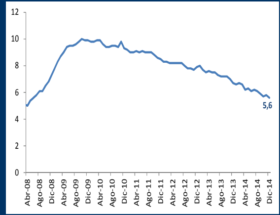
Gráfico 1: EE.UU. - Tasa de desempleo (Variación mensual)