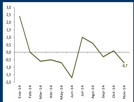
Gráfico 3: Brasil - Producción industrial (Variación mensual)