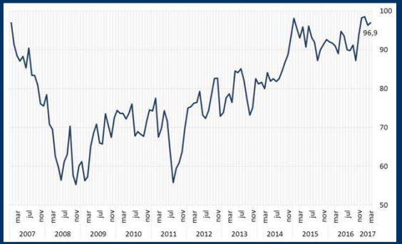
Gráfico 1: Estados Unidos: Sentimiento del consumidor de la U. de Michigan (En puntos)