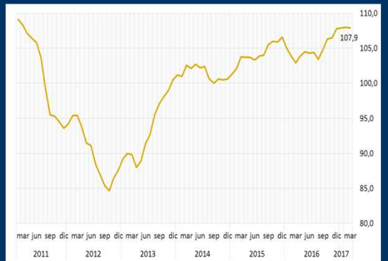
Gráfico 2: Zona Euro: Índice de sentimiento económico (En puntos)