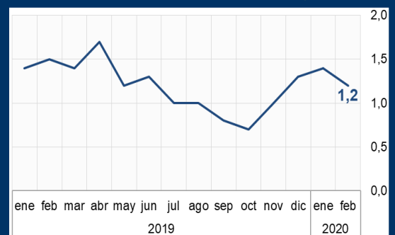
Gráfico 2: Zona Euro - Inflación (Variación interanual; en porcentaje)