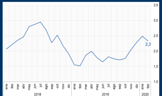
Gráfico 2: EE.UU. - Índice de precios al consumidor (Variación interanual; en porcentaje)