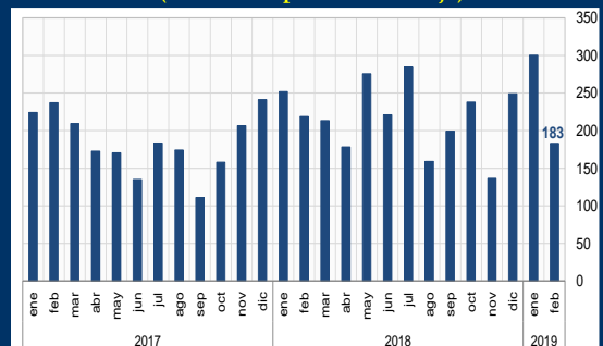
Gráfico 2: EE.UU. - Nómina de empleo del sector privado no agrícola (En miles de puestos de trabajo)