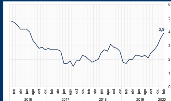
Gráfico 3: Chile - Inflación (Variación interanual; en porcentaje)