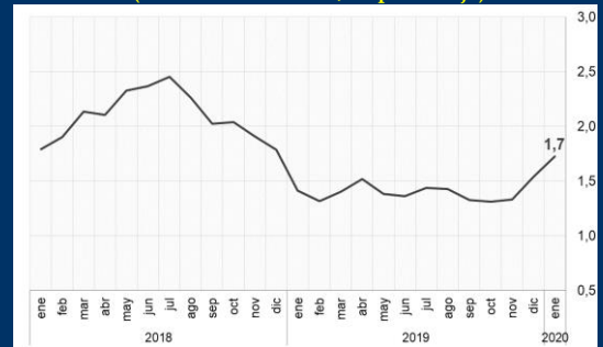
Gráfico 1: EE.UU. - Índice de precios de gastos del consumidor (Variación interanual; en porcentaje)

NOTA: 1 A partir del 15/11/2017, los activos del FPAH son invertidos de acuerdo a la composición por monedas de los depósitos del público en el sistema financiero, de manera análoga a las inversiones realizadas por el FONDO RAL.