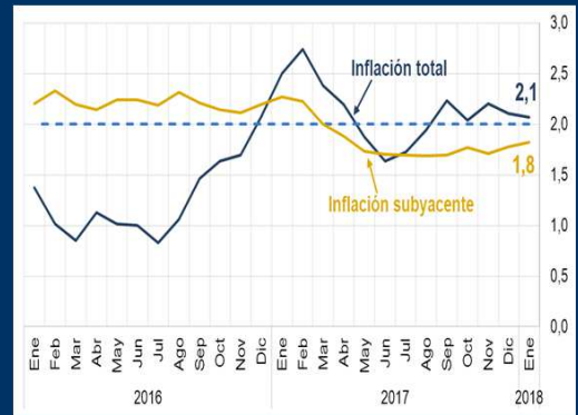
Gráfico 1: EE.UU. - Indicadores de inflación (Variación interanual; en porcentaje)