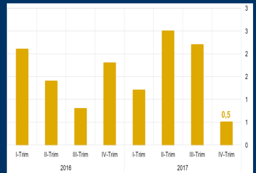
Gráfico 3: Japón - Actividad económica (Tasa anualizada; en porcentaje)