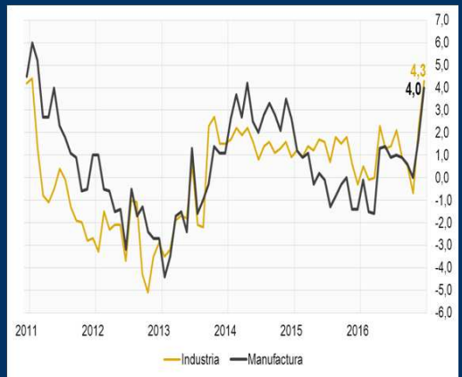
Gráfico 2: Reino Unido - Producción industrial y manufacturera (En porcentaje)