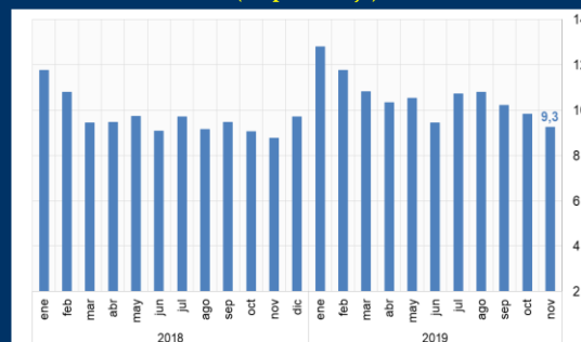
Gráfico 3: Colombia - Tasa de desempleo (En porcentaje)