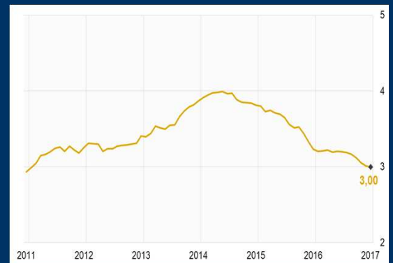
Gráfico 2: China - Reservas internacionales (En billones de dólares)