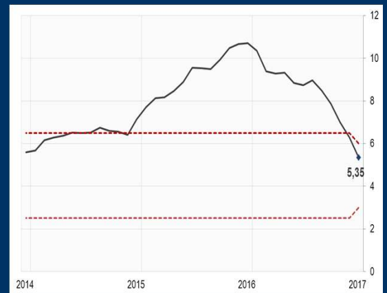
Gráfico 3: Brasil - Inflación interanual (En porcentaje)