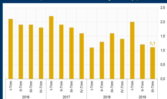
Gráfico 2: Reino Unido - Actividad económica (Variación interanual; en porcentaje)