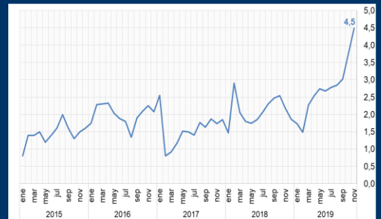
Gráfico 2: China - Inflación (Variación interanual; en porcentaje)