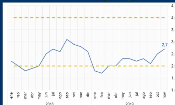
Gráfico 3: Chile - Inflación (Variación interanual; porcentaje)