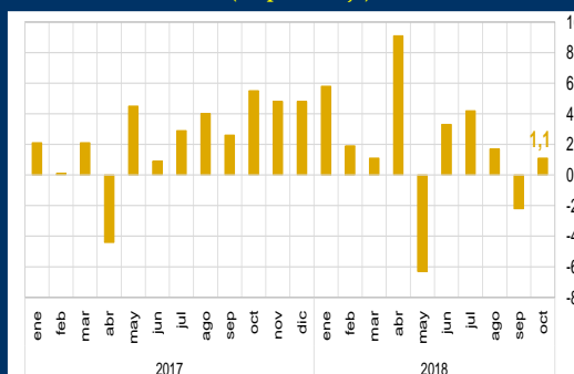
Gráfico 2: Brasil - Producción industrial (En porcentaje)